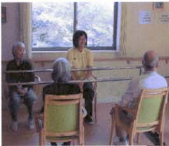
バーを使用するの体操風景