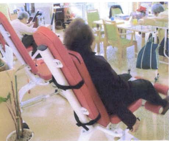
マシンを利用した運動風景